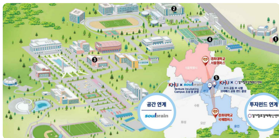
① 창업보육센터(애지원BI) ② 창업교육센터(우정원) ③ 메이커스페이스(오픈랩) ④ 공과대학(오픈랩) ⑤ 경희판교 VI (성남시)